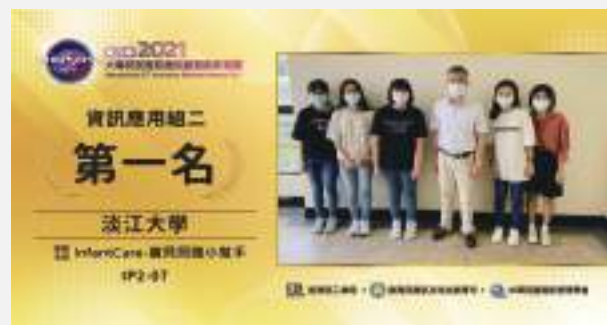
資訊應用組第一名