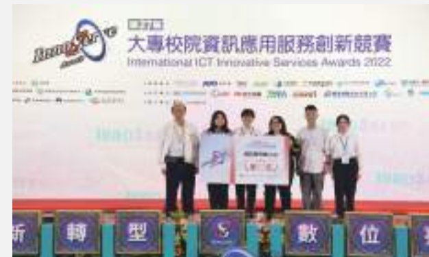
資訊應用組第三名