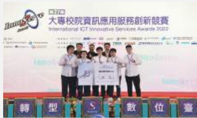
資訊應用組第二名