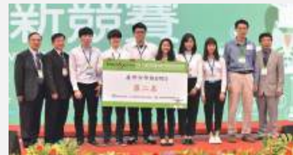
產學合作組第二名