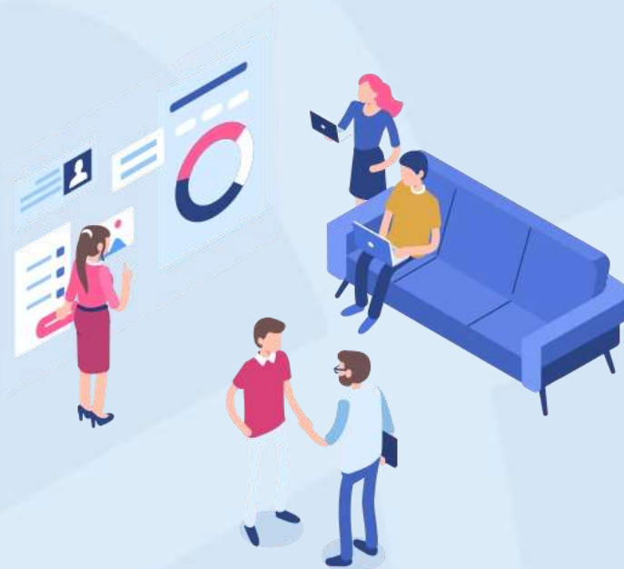
Cyber Security Market Report Scope